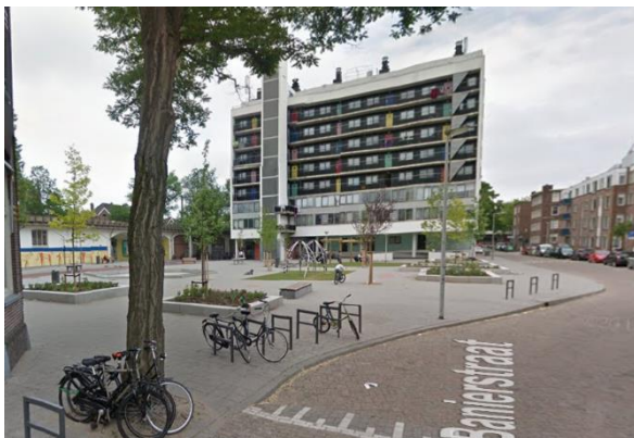
Figuur 2 Nieuwe situatie