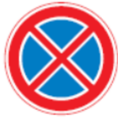
E2 Verbod stil te staan