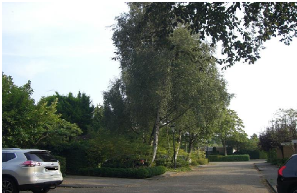
Afbeelding 3 het straatbeeld van de andere zijde