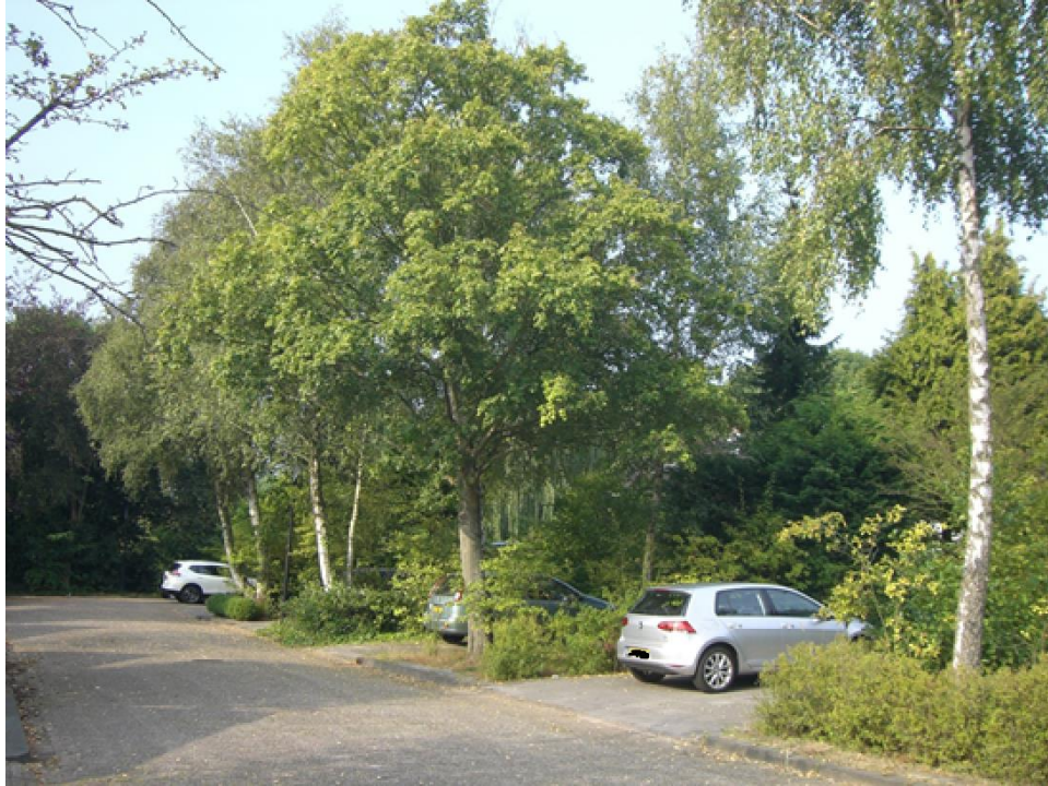
Afbeelding 2 de Anna Paulownalaan op 13 september 2016