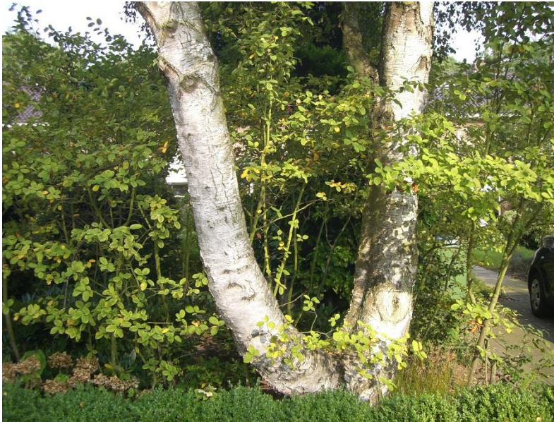
Afbeelding 4 de berk, die bij mevrouw H. en de heer F. overlast veroorzaakt met 'dubbele' stam