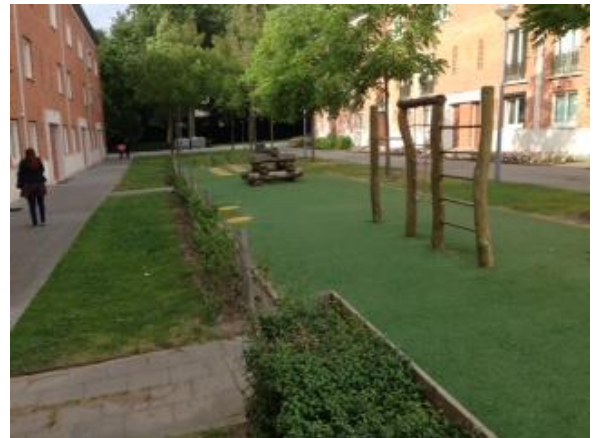
Foto van de ombudsman van de Ellewoutsdijkstraat tijdens het bezoek ter plaatse op 29 juli 2016