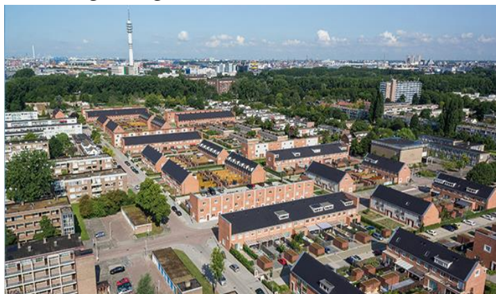
Uit: DE GAARDEN, De Tuin op het Zuiden, bladzijden 11 en 12

De afspraak is dat Woonstad de buitenruimte inricht en die daarna aan de gemeente overdraagt. De gemeente zal de buitenruimte verder onderhouden.