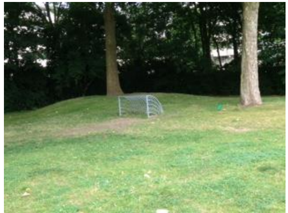
Foto van de ombudsman, gemaakt tijdens het bezoek ter plaatse op 29 juli 2016 van het trapveldje