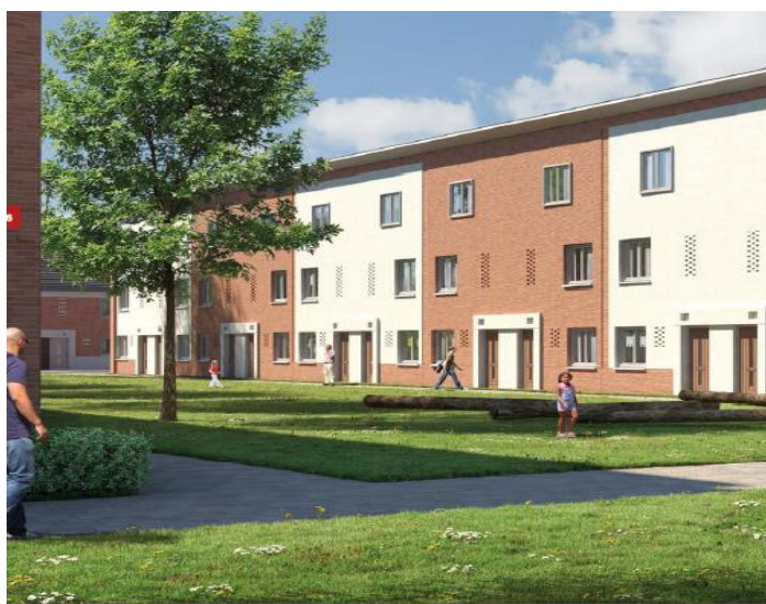
Uit: DE GAARDEN, De Tuin op het Zuiden, bladzijden 16 en 17

Huizen staan tegenover elkaar met daartussen een strook groen met een enkel speeltuig. Deze speeltuigen zijn bedoeld voor kinderen van 4 tot 8 jaar.