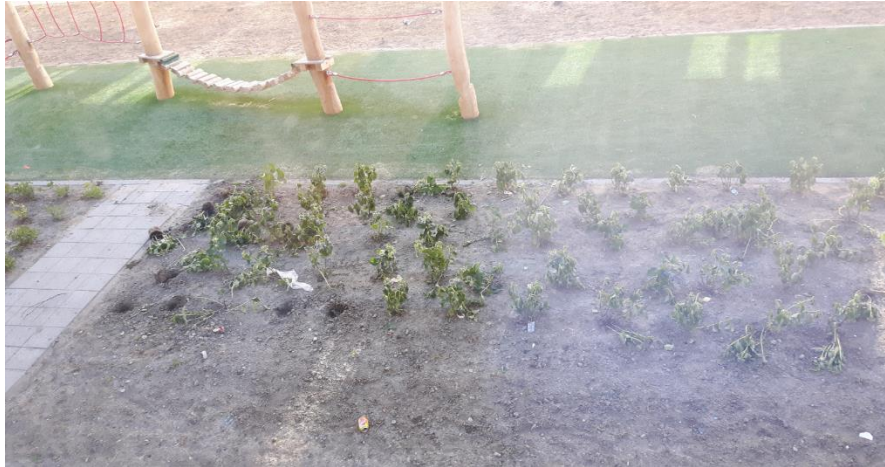
Foto van vernielde aanplant, gemaakt door een van de klagers vanuit zijn woning aan de Rilland Bathstraat