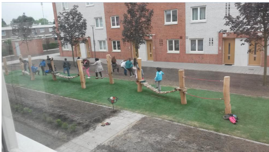
Foto van een spelende schoolklas, gemaakt door van een van de klagers vanuit zijn woning aan de Rilland Bathstraat