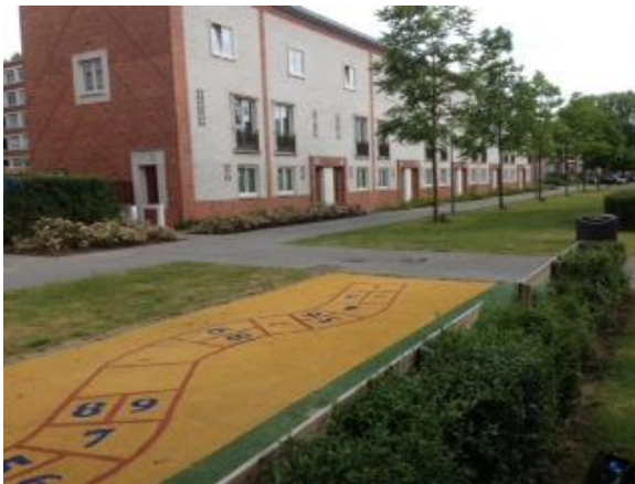
Foto van de ombudsman van de Ellewoutsdijkstraat tijdens het bezoek ter plaatse op 29 juli 2016