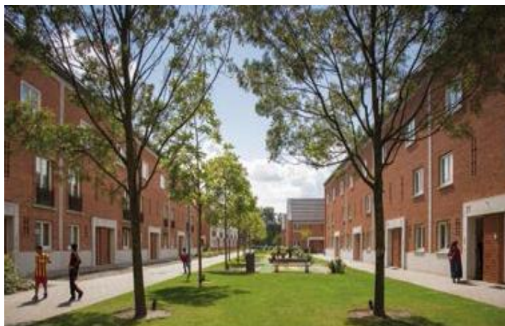
Uit: DE GAARDEN, De Tuin op het Zuiden, bladzijde 6

Huizen staan tegenover elkaar met daartussen een strook groen met een enkel speeltuig. Deze speeltuigen zijn bedoeld voor kinderen van 4 tot 8 jaar.