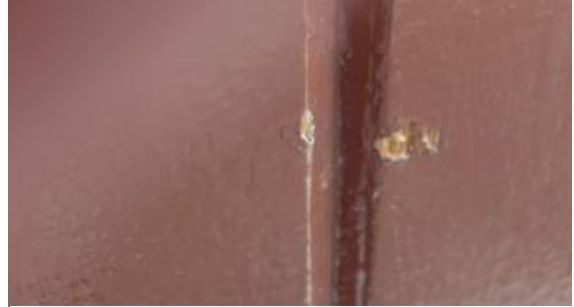
Foto van de ombudsman gemaakt tijdens het bezoek ter plaatse op 29 juli 2016 van de schade aan de voordeur van een van de klagers aan de Ellewoutsdijkstraat, door voetballen die tegen zijn voordeur aangetrapt zijn